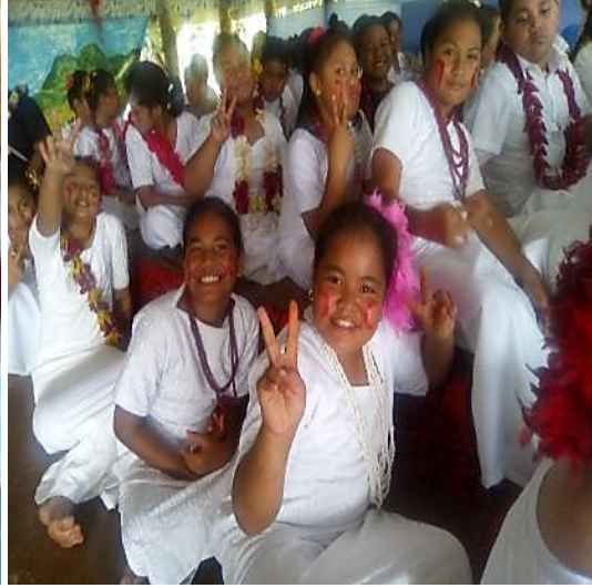
O le fa'amanatuina o le 20 tausaga talu ona fa'avaeina le A'oga a Samoa Primary. Na va'aia le aulelei ma le matagofie o teuga a le fanau ma latou fa'afiafiaga mo lea aso fa'apitoa.