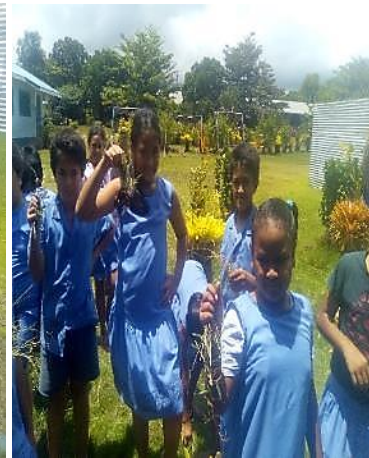
O galuega fa'atino i fafo, e a'oa'o ai tamaiti e vele ma fa'amama le lapisi ina ia manaia le siosiomaga ma lelei le ola soifua maloloina.